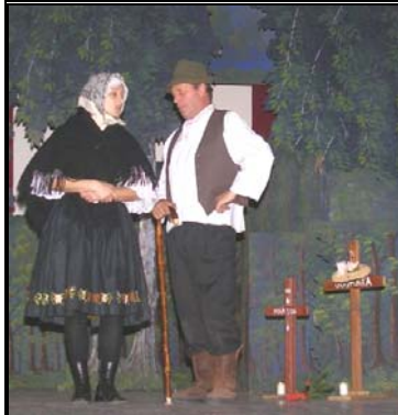
Žiaľ pri hroboch