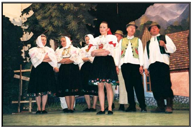
„Ovseniskóo ...“, pieseň na začiatku hry