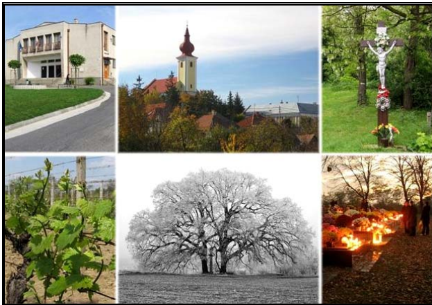
Jarok -Obecný úrad, kostol, kríž, vinica, strom, Hroby lásky