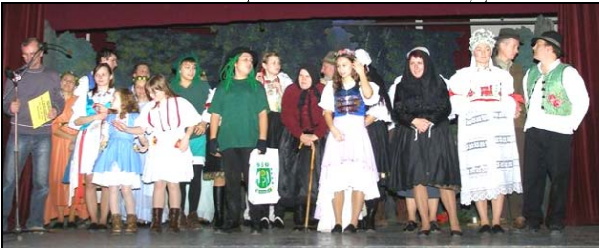
Pred posledným úklonom obecnstvu v roku osláv 30. výročia činnosti folklórnych zoskupení a prezentácie ľudových tradícií v Rumanovej pod vedením jednej generácie ochotníkov a aktivistov a tiež v roku osláv 850. výročia prvej písomnej zmienky o našich predkoch.