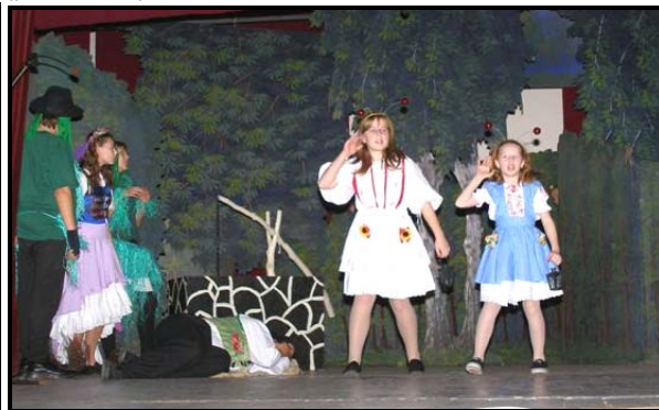
Svätojánske mušky, vodníci, lesná žienka, nešťastník