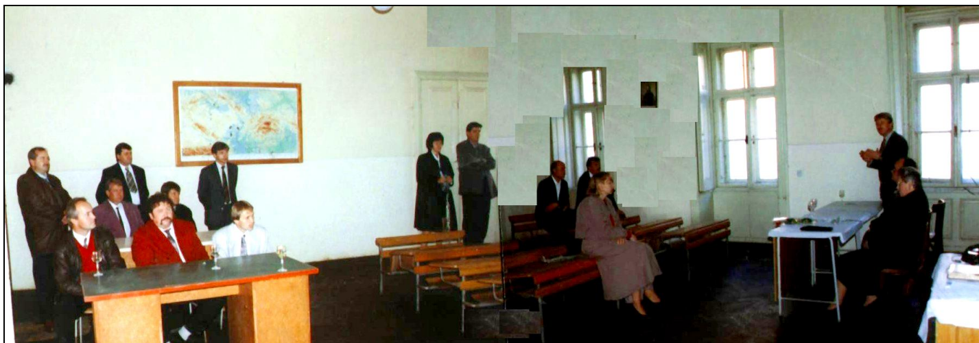
Časť účastníkov poslednej spoločenskej udalosti v kaštieli, školskej budove, dňa 10.10.1999.

Všetci žiaci Základnej deväťročnej školy v Rumanovej, ktorí nastúpili do prvej triedy 1. septembra 1965 alebo ktorí ukončili povinnú školskú dochádzku 30. júna 1974, nech sa už ako čerství päťdesiatnici zúčastnia povinného stretnutia, ktoré sa bude konať v sobotu, dňa 19.09. 2009 v čase od 15, 00 do 21, 00 hod. Keďže školská budova nám medzičasom schátrala, stretnutie sa uskutoční neďaleko jej múrov, v spoločenskej miestnosti Kultúrneho domu v Rumanovej, na prízemí. Prosím blízke a vzdialené rodiny príbuzných, ktorí dostali do rúk tieto noviny, aby informovali o podujatí tých, ktorí sú uvedení v zozname pod fotografiou. Budeme veľmi potešení, ak sa stretnutia zúčastnia aj naši ctení učitelia. Jediným bodom programu bude triednická hodina, na ktorej bude verbálne testovaná naša pamäť.