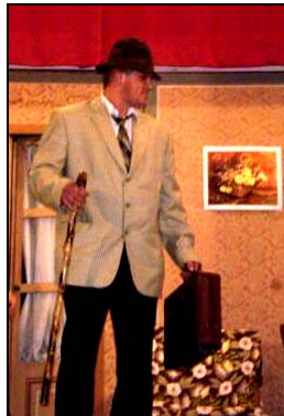
*Rudolfov otec prichádza