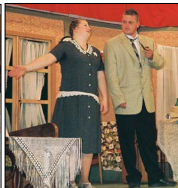
*Matka, otec, Viera