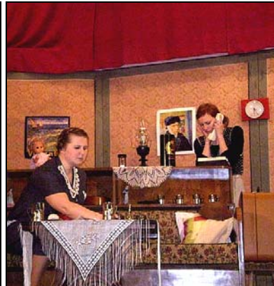
*Vierina matka a Viera