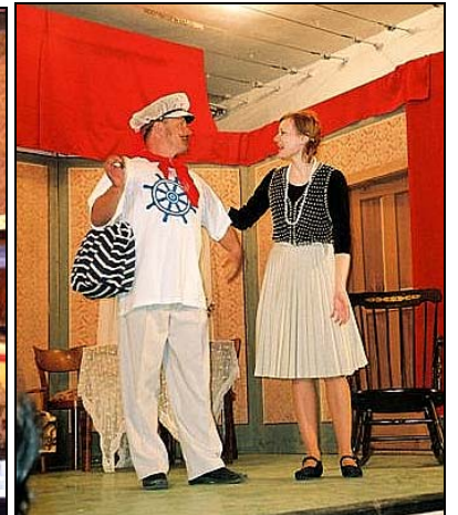
*Oto a Viera