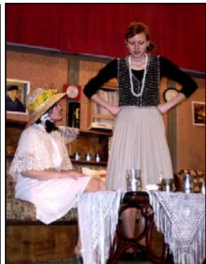
*Jaja a Viera