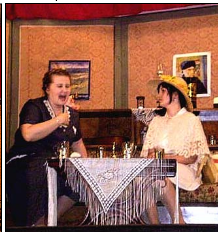
*Vierina matka a Jaja