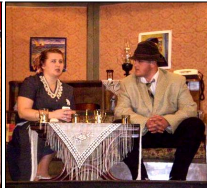
*Vierina matka a Rudolfov otec