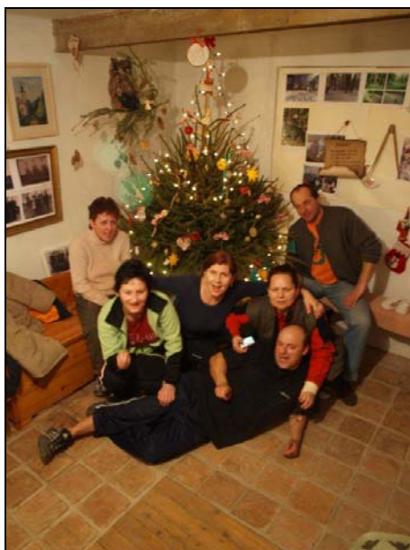
A sme doma. Ešte sú tohtoročné Vianoce...